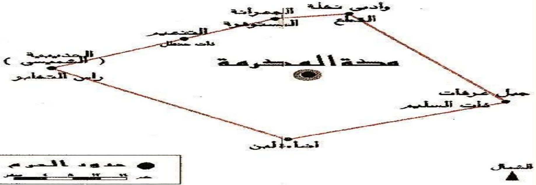
خريطة حدود الحرم المكي